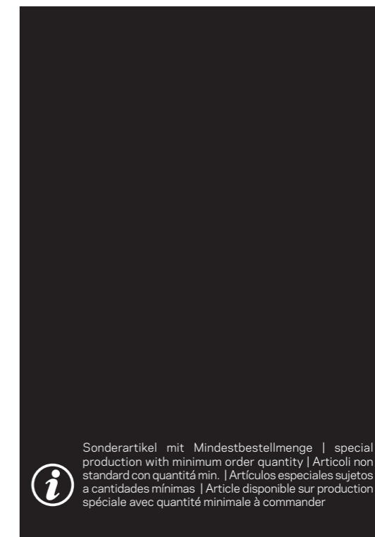
942 904 Polyplan Food Industrial Water Type II