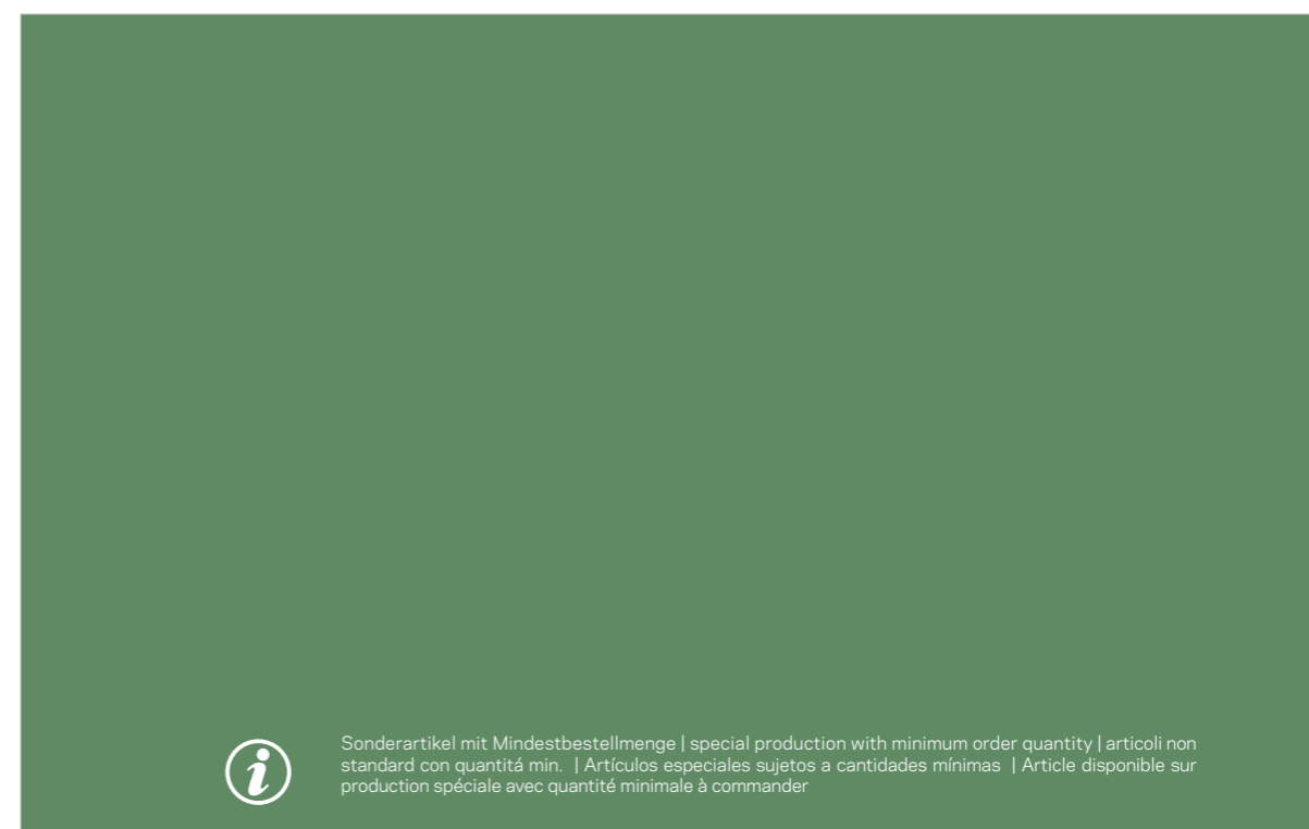
955 637 | Polyplan Food Industrial Water Type II Heavy