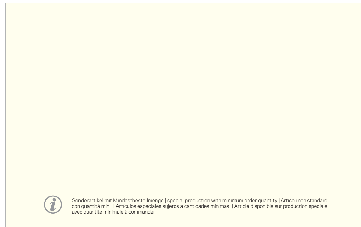
953 004 | COMPLAN Side-Curtain View